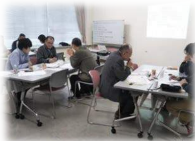
マッチング交流会の様子