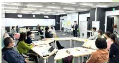
「在宅医療・介護連携推進」研修の活性化に向けた市町を越えた多職種連携ワークショップの開発