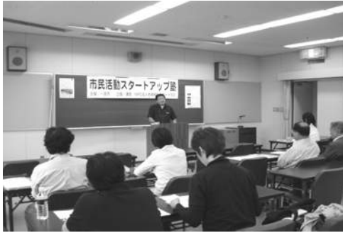
3日目「一宮のまちと市民活動」