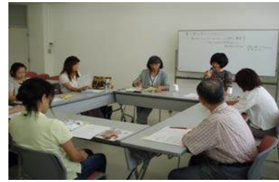
第 2 回 「Ada-coda」の実践