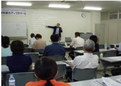
連続講座「協働の制度活用」