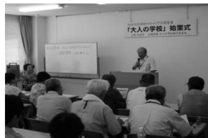
「大人の学校」始業式

これからの人生を豊かにするための「調べる・学ぶ・体験する」をキーワードに、さまざまな情報をもとに、これからの時間をどう生きる？このまちでどう暮らす？を一緒に考えます。