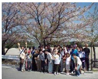
4 月桜並木を散歩して

「ふいっと」という名称は、障がいのある本人さんたちにフィットする活動と、フィットネスということからつけています。クラブでは子どもたちとボランティアさんが 1 対 1 で関わる事を基本として、障がいのある子どもでもわかりやすいようなプログラムを組んでいます。音楽に合わせて体を動かしたり、ボール・フラフープなど使って運動したりと、日頃の運動不足を解消できる楽しい時間となっています。学生や地域の方との関わりは、彼らのことを理解してもらう良い機会となっています