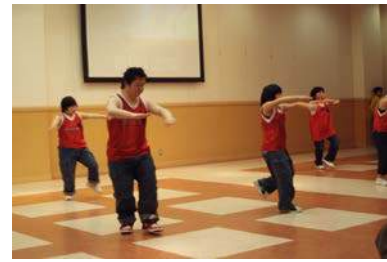
MIX JAMによるヒップホップダンス

＜目的＞ 発達障がい理解促進の啓発パンフレットを東浦町を中心に広く一般にPRすることを目的としたイベント ＜プログラム＞