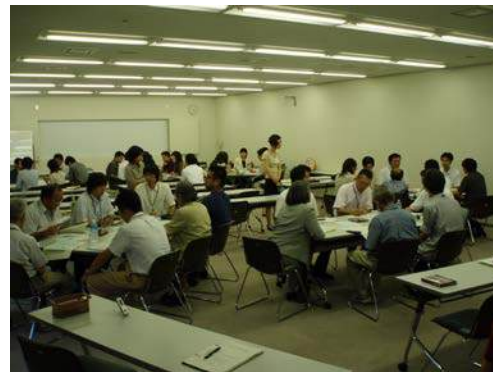
NPO支援センタースタッフ力強化研修