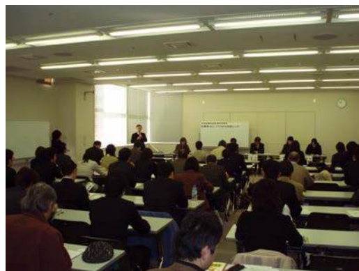
あいち協働ルールブック推進フォーラム

修の成果発表としては、「協働拠点としてのNPO支援センターのあり方」と題して、各支援センターの20年度実践と新年度企画の報告として、半田市・刈谷市・豊田市のセンターが発表した。課題研究型研修では、それぞれのテーマごとに研究者としての職員が経過と成果を報告した。