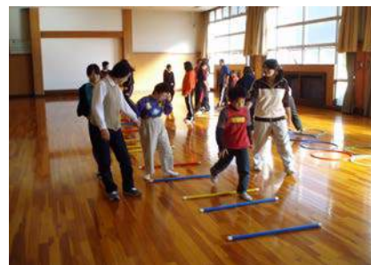
体育館内の活動の様子

「ふいっと」という名称は、障がいのある本人さんたちにフィットする活動と、フィットネスということからつけています。クラブでは子どもたちとボランティアさんが 1 対 1 で関わる事を基本として、障がいのある子どもでもわかりやすいようなプログラムを組んでいます。音楽に合わせて体を動かしたり、ボール・フラフープなど使って運動したりと、日頃の運動不足を解消できる楽しい時間となっています。学生や地域の方との関わりは、彼らのことを理解してもらう良い機会となっています