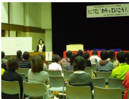
レッドビッキーズ活動を通して～講演