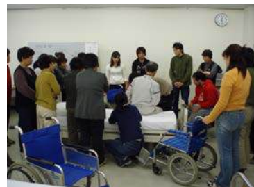
基本介護技術の様子

安心と豊かさの実現できる地域福祉を担う人材育成、及び市民をはじめ、行政、企業の人々に NPO の理解と学びの場を提供することを目的に、半田会場で1回、知多会場で1回、日本福祉大学美浜キャンパスで大学生対象1回(春期講座)の計3回の講座を開催しました。