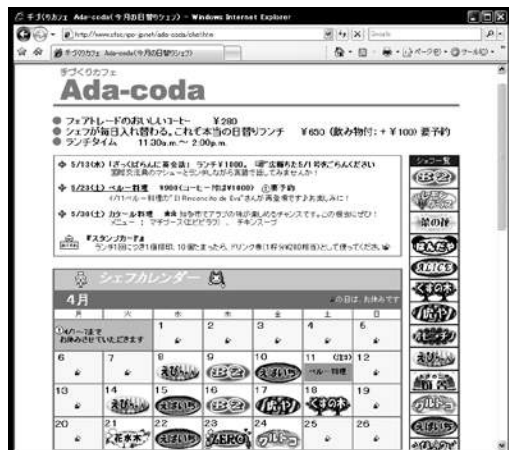
Ada-coda 日替わりシェフ表

サポートちたの事業案内、報告、概要などを WEB サイトにて情報発信中。各種講座やイベントの情報なども、随時掲載。掲示板を使った双方向的なコンテンツも展開中です。