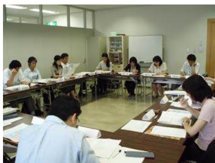
「NPOとの地縁型組織との連携」の研究会

「NPOと地縁型組織等との連携」「NPOへの資金支援制度」の二つのテーマで、市町村職員が自分の市町の現状分析を基に、方策を練っていく研究会を開催し、成果報告書にまとめた。サポートしたは、地縁型組織との連携のグループに対し、記録とアドバイザーの役割で関わった。