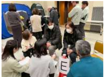
巡回時、避難所状況確認シートの項目を参考にヒアリングする参加者ら

接点の少なかった団体同士が顔を合わせる機会となった。互いの活動や役割を知ること、今後の連携の可能性が広がり、平時からのつながりづくり