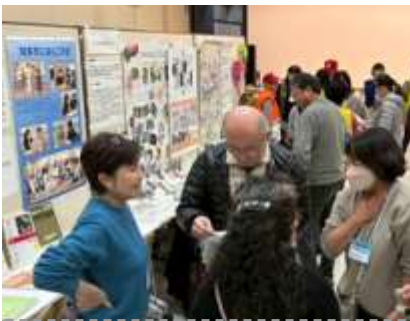
トレーディングカード交換をすることで団体間の会話が弾んだ

本企画の目玉は、活動団体ごとに作成したトレーディングカード。表面に活動の様子をイメージしたイラストや、活動内容やアピール情報を掲載、裏面には、共感ポイントや一緒にできることを書くメモ欄を設けた。