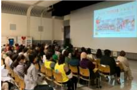
第1部『ぎゅっとパパママ学級知多産前産後ケア』による協働事例の発表の様子

知多市市民活動団体による事例発表や活動展示を通して、他団体の取り組みを知り、つながりあう機会として、1月18日に知多市勤労文化会館やまも